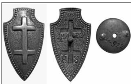
1.4 pav. Lietuvos šaulių sąjungos ženklas. Nešiojamas rikiuotėje. 1937 m. pavyzdžio. Nr. 18722. Dydis – 50 x 28 mm LNM, M 922