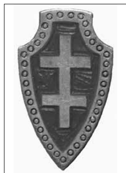
2 pav. Lietuvos šaulių sąjungos rėmėjo ženklelis. 1926 m. Šveicarija. Dydis – 19 x 11 mm LNM, M 5378